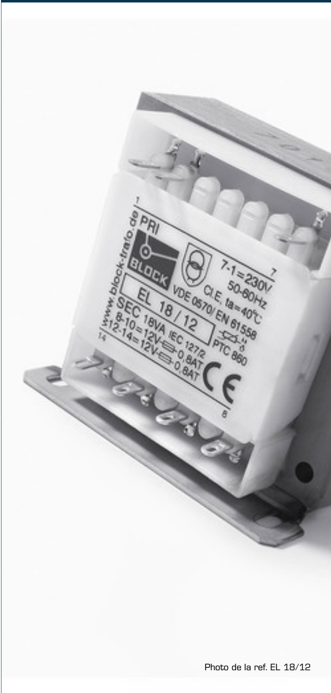
Photo de la ref. EL 18/12