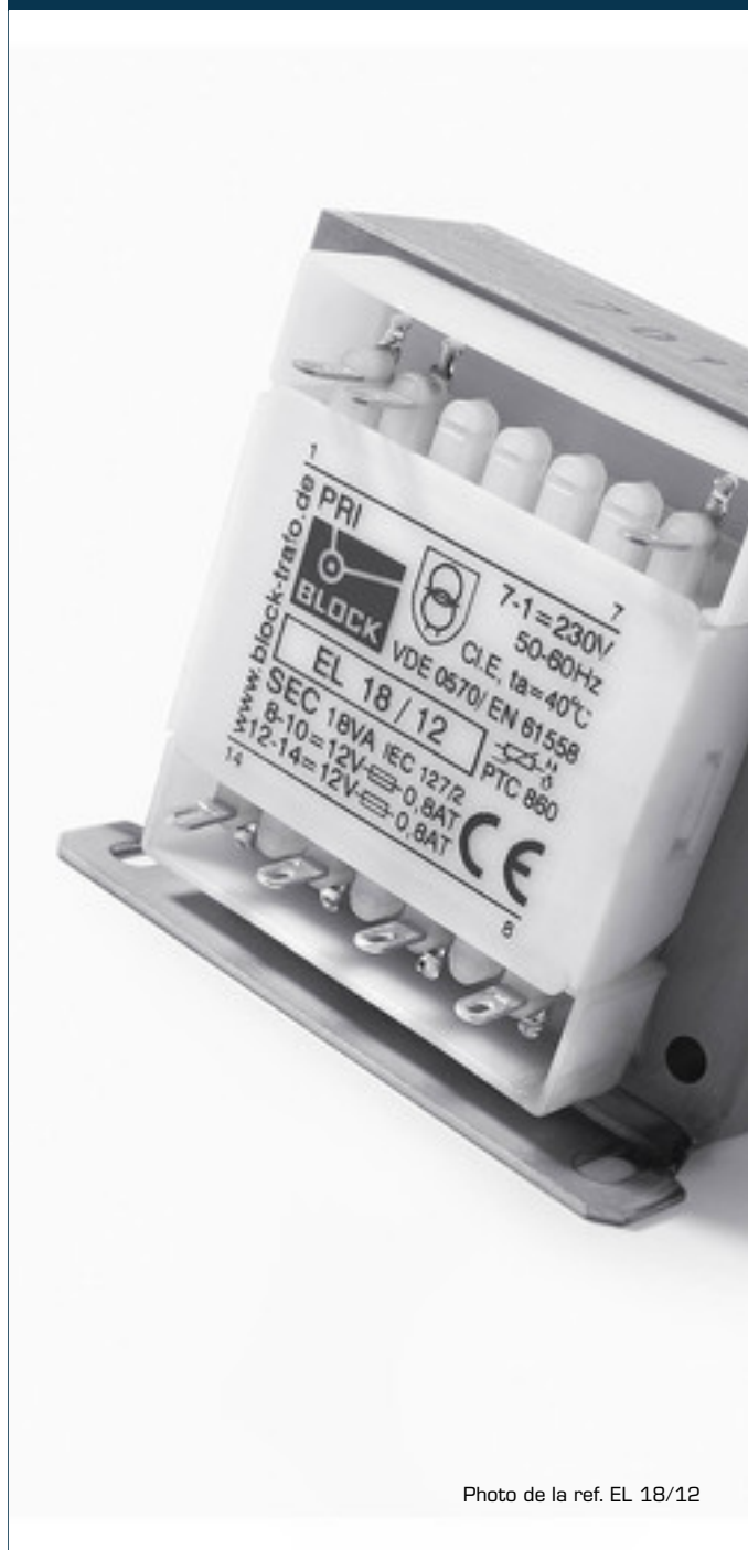
Photo de la ref. EL 18/12