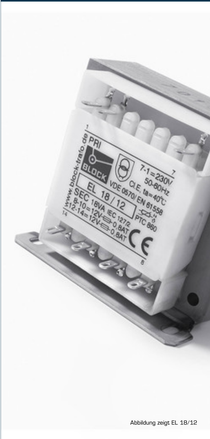
Abbildung zeigt EL 18/12