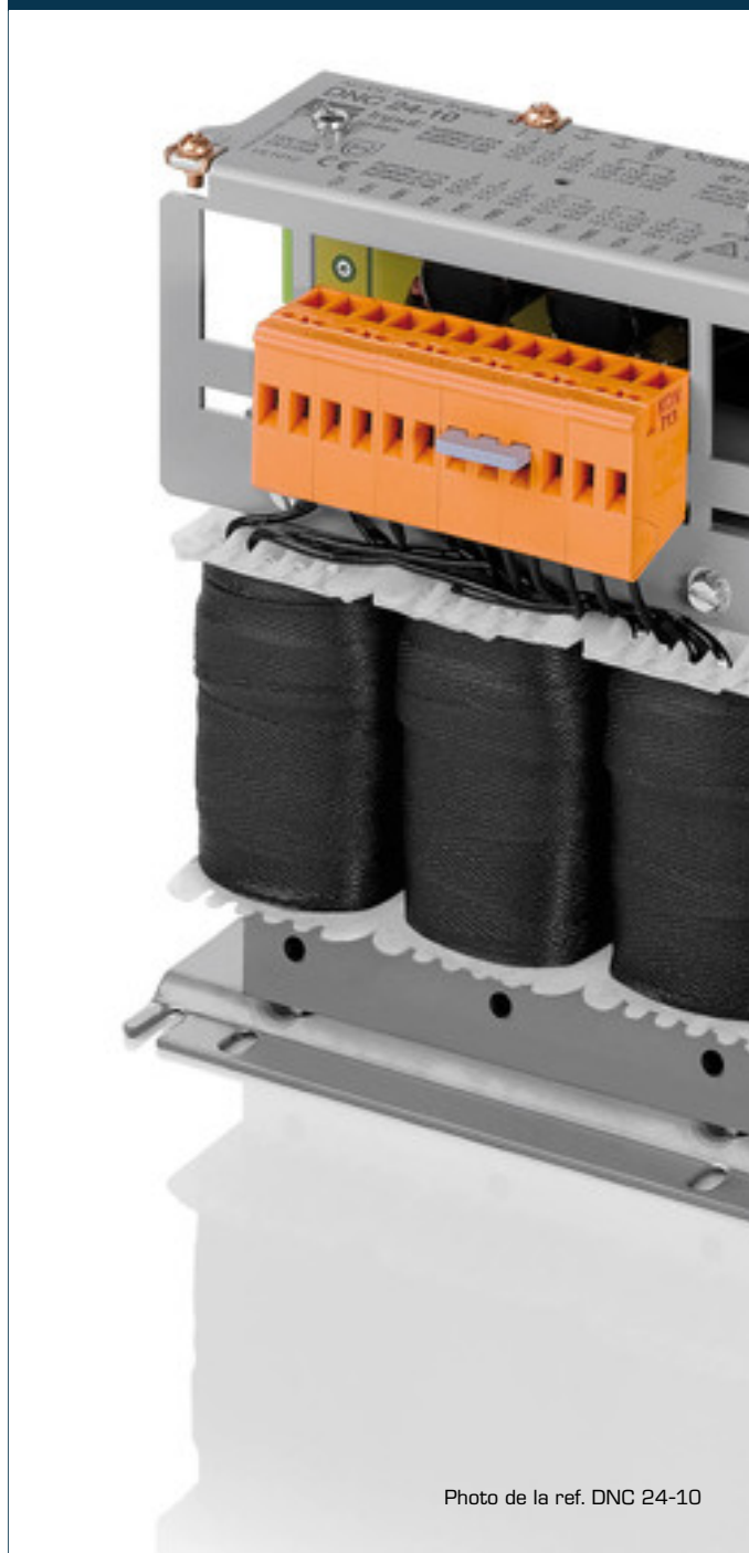
Photo de la ref. DNC 24-10