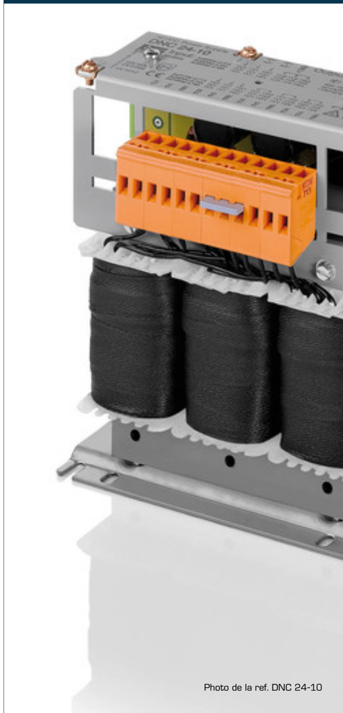
Photo de la ref. DNC 24-10