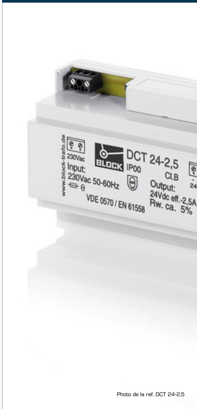
Photo de la ref. DCT 24-2,5