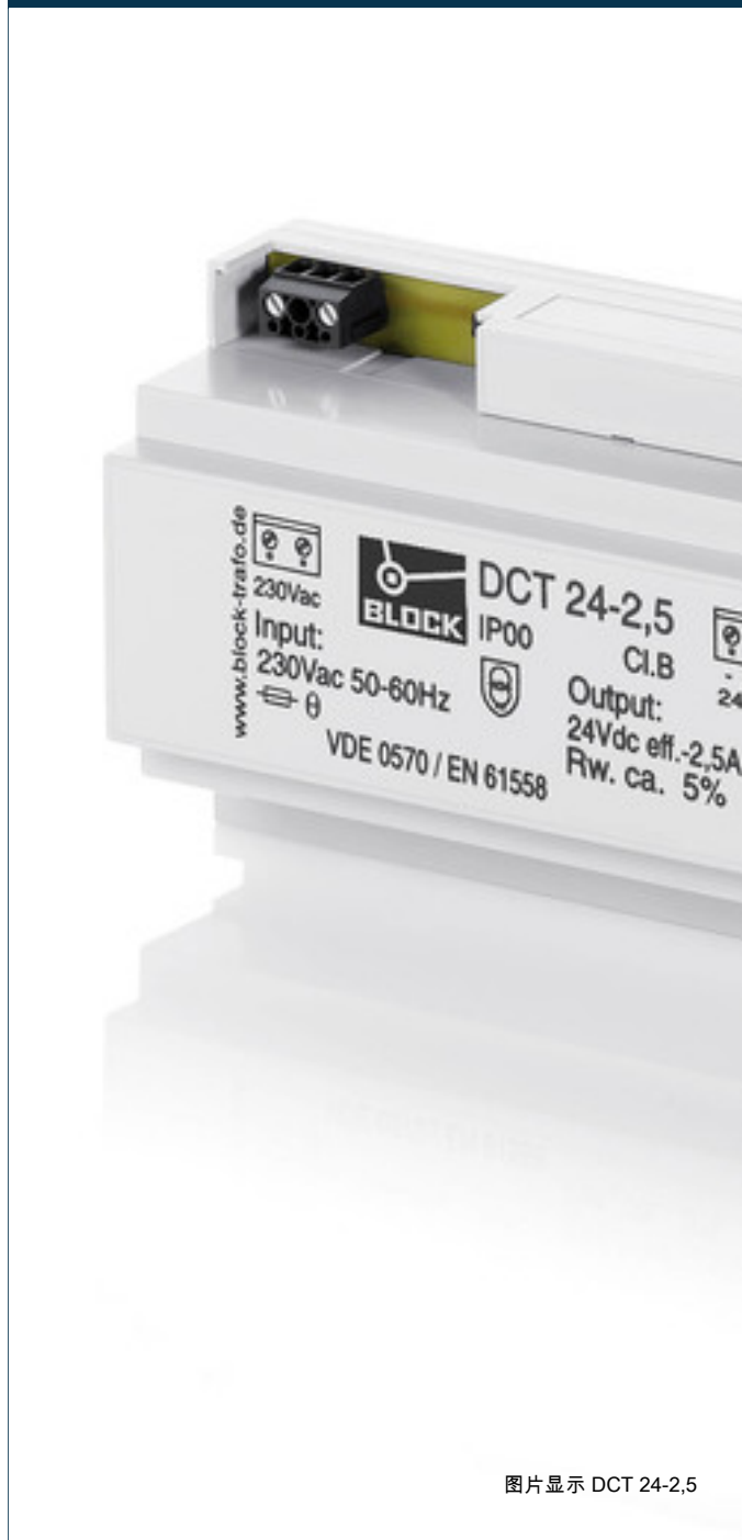
图片显示 DCT 24-2,5