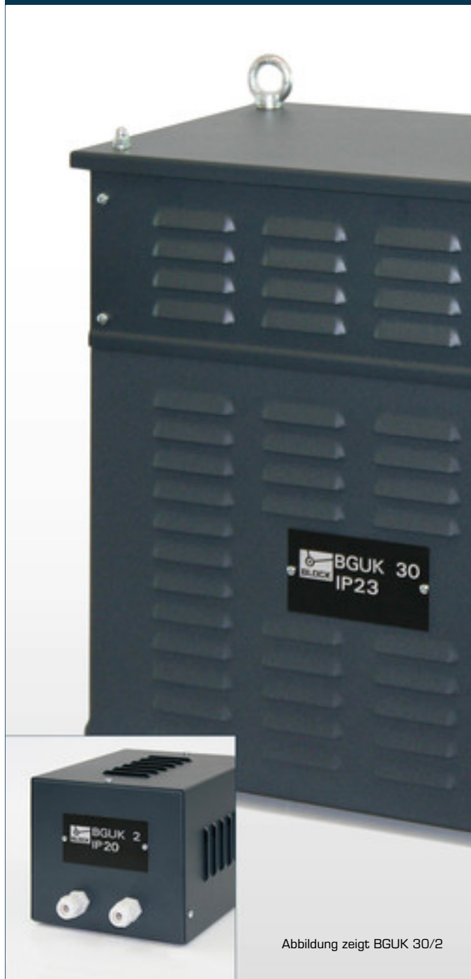
Abbildung zeigt BGUK 30/2