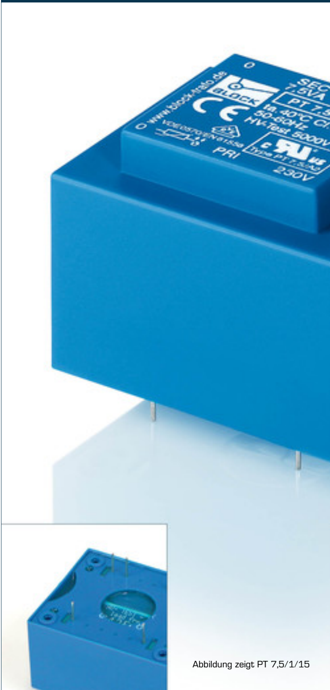
Abbildung zeigt PT 7,5/1/15