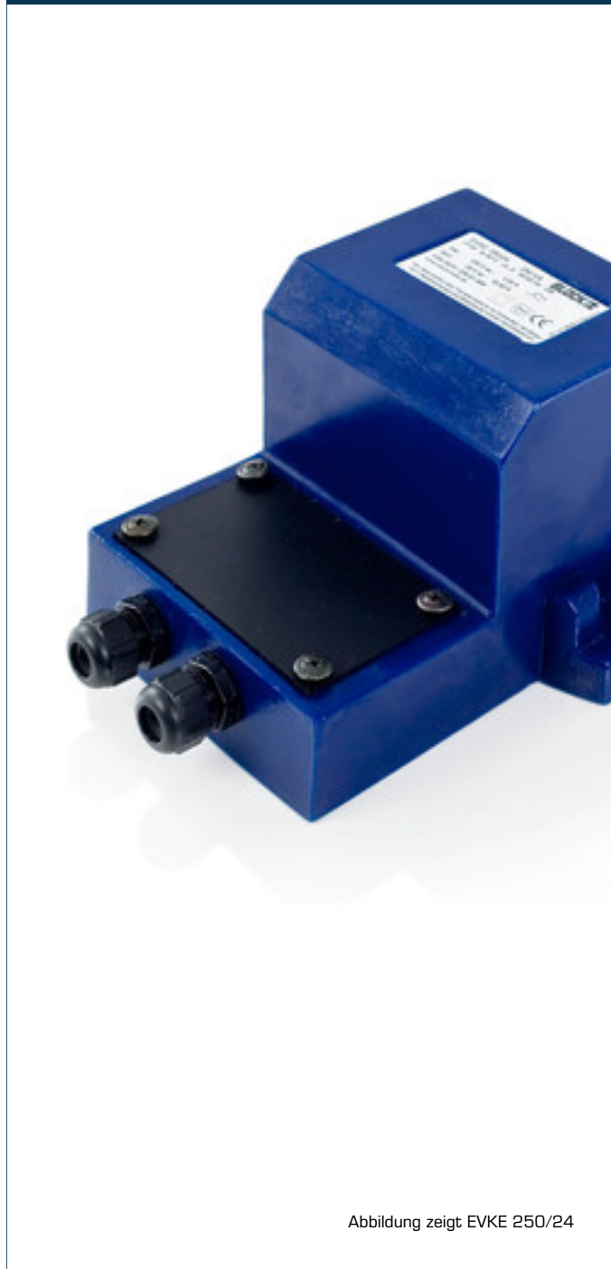
Abbildung zeigt EVKE 250/24